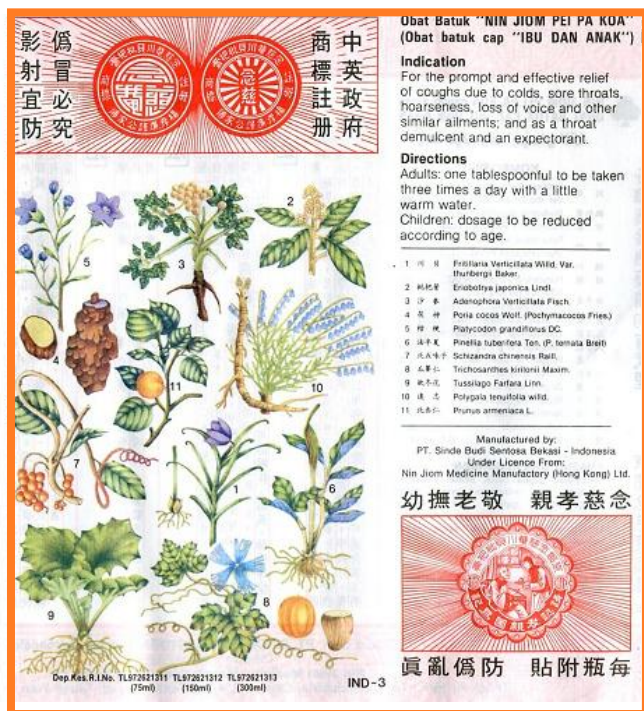
Erbe ,fiori e radici del Nin Jiom Pei Pa Koa raffigurate sulla confezione del prodotto

Uno studio condotto presso l'Accademia cinese di medicina tradizionale, pubblicato in un articolo del 1994, "Studi farmacologici sul Nin Jiom Pei Pa Koa", afferma che Nin Jiom Pei Pa Koa "ha avuto un significativo risultato nell'alleviare la tosse con effetti di rimozione dell'espettorato. Ha inoltre avuto un effetto evidente sull' alleviare i sintomi dell' asma in vivo e in vitro." All'interno della tradizione cinese, lo sciroppo Nin Jiom Pei Pa Koa è considerato un efficace integratore capace di sostenere i liquidi all'interno dell'organismo, con particolare vantaggio per il polmone e lo stomaco. Viene consigliato quindi nei casi di : sete, bocca secca, mal di gola, afonia, nausea, dispepsia, tosse e asma. Permette di mantenere la tonicità e l'equilibrio sistemico del corpo, migliorando l'acutezza della concentrazione e la portata di attenzione. Si rivela un utile supporto anche in molti casi di spossatezza fisica.