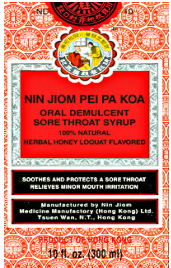
La confezione rossa dello sciroppo con il logo storico